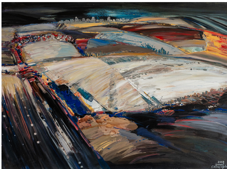
'Thrace', acrilico su tela, 70 x 100 cm, 2018

Estopia è lieta di presentare Vicinanza / Nähe , mostra personale di İsmet Çavuşoğlu concepita per il suo spazio di Aosta, con l'inclusione di un'opera di Ergin Çavuşoğlu.